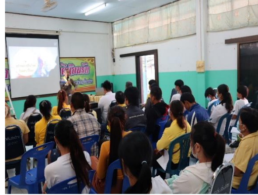
โครงการส่งเสริมการเรียนรู้ประวัติศาสตร์ชาติไทย