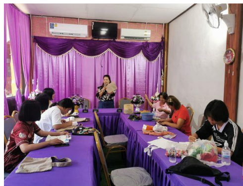
กิจกรรมศูนย์ฝึกอาชีพชุมชน โครงการส่งเสริมอาชีพพระยะสั้นการพัฒนาผลิตภัณฑ์รูปแบบงานปักผ้า