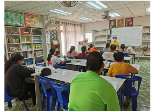
กิจกรรมพัฒนาคุณภาพผู้เรียน สอนเสริมเพิ่มเติมความรู้