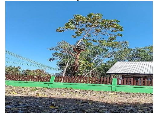
ปรับภูมิทัศน์ศูนย์การเรียนรู้ตำบลนายาง