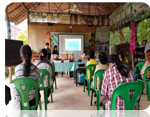
โครงการส่งเสริมการเรียนรู้การปลูกผักสมุนไพรเพื่อสุขภาพบนพื้นฐานของหลักปรัชญาเศรษฐกิจพอเพียง