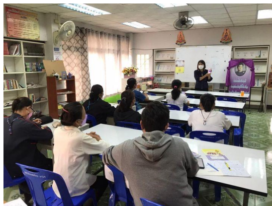
ตำบลนายาง