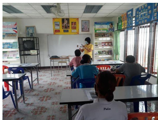
ตำบลแม่แก้วะ