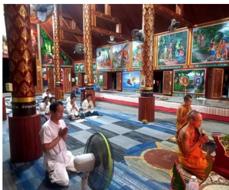
โครงการพัฒนาผู้เรียนธรรมะนำชีวิต จัดโดย กศน.อำเภอสบปราบ