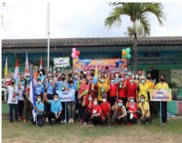
โครงการกีฬาสามัคคีสัมพันธ์ต้านภัยยาเสพติดเพื่อ เสริมสร้างสุขภาพกายสุขภาพจิตที่ดีให้ผู้เรียน