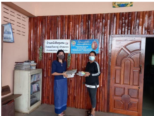
บ้านหนังสือชุมชน หมู่ ๔ บ้านหนองบัวแดง