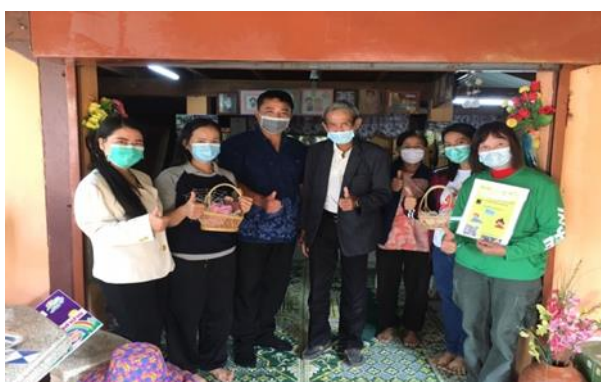
บ้านหนังสือชุมชน หมู่ ๕ บ้านทุ่ง