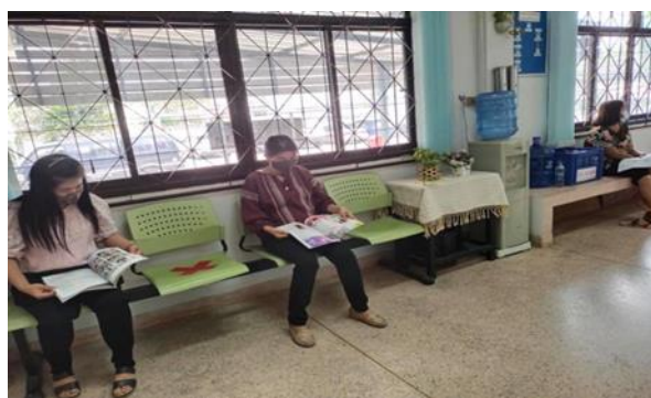
บ้านหนังสือชุมชน หมู่ ๒ บ้านสบปราบเหนือ