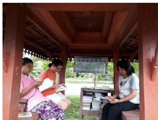
บ้านหนังสือชุมชน หมู่ ๘ บ้านวังยาวเหนือ