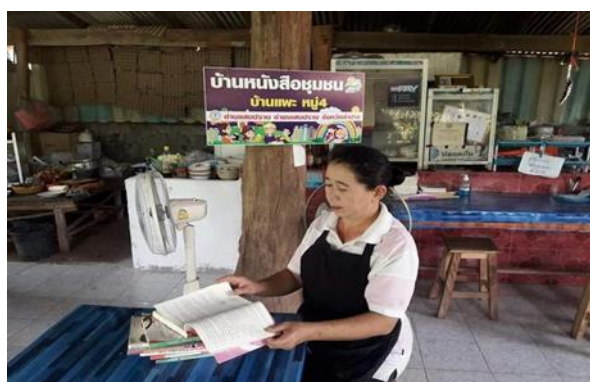
บ้านหนังสือชุมชนหมู่ ๔ บ้านแพะ