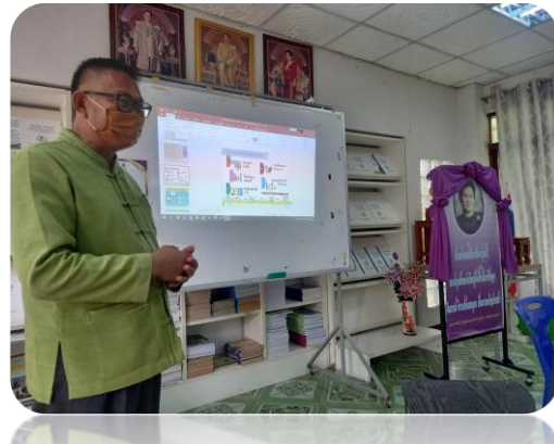
โครงการเสริมสร้างความรู้เกี่ยวกับประชาธิปไตย