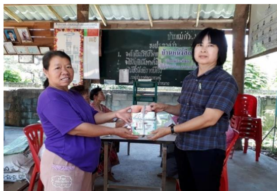
บ้านหนังสือชุมชน หมู่ ๕ บ้านแม่กัวะนอก