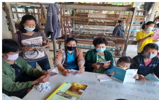
บ้านหนังสือชุมชน หมู่ ๒ บ้านน้ำหลง