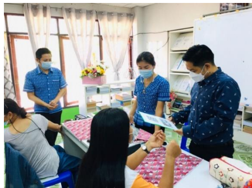
นิเทศการศึกษาต่อเนื่อง