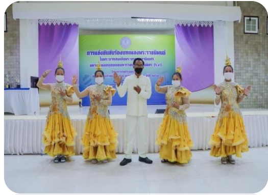
กศน.ตำบลนายาง กิจกรรมบทเพลงพระราชนิพนธ์ใน พระบาทสมเด็จพระบรมชนกาธิเบศรมหาภูมิพลอดุลยเดชมหาราชบรมนาถบพิตร (ร.๙)