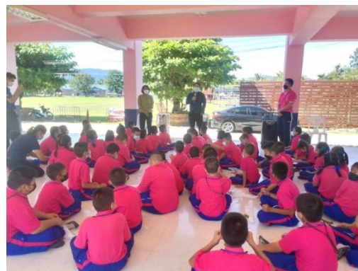
นิเทศการศึกษาตามอัธยาศัย