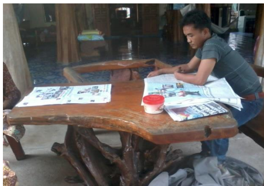
บ้านหนังสือชุมชน หมู่ ๙ บ้านจัวกลาง