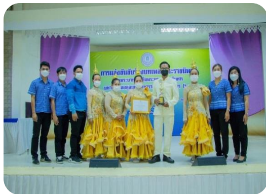
รางวัลชนะเลิศ ระดับมัธยมศึกษาตอนต้น ณ หอประชุมร่มไทร สถาบัน กศน.ภาคเหนือ จังหวัดลำปาง