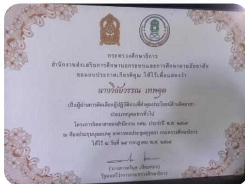
นำนักศึกษาจิตอาสาปลูกต้นไม้เพื่ออนุรักษ์ทรัพยากรธรรมชาติผู้ปฏิบัติงานที่ทำคุณประโยชน์ด้านจิตอาสา