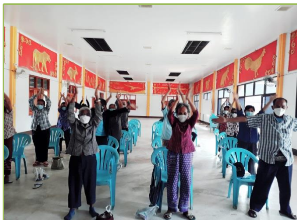
กศน.ตำบลแม่กัวะ กิจกรรมส่งเสริมความรู้การป้องกันตนเองจากโรคไวรัสโควิด-๑๙ กิจกรรมการออกกำลังกายการเพื่อสุขภาพสำหรับผู้สูงอายุ