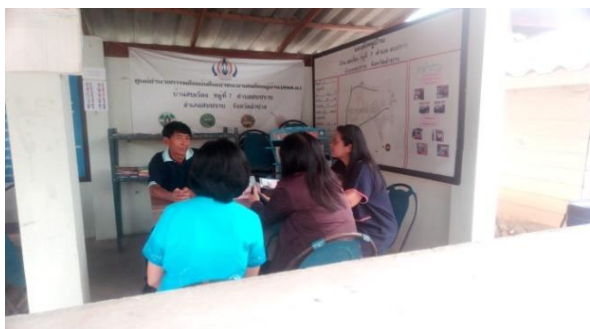
บ้านหนังสือชุมชน บ้านสบเรียง