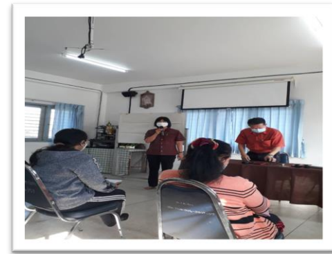
โครงการอบรมป้องกันโรคระบาดในชุมชนไวรัสโควิด-๑๙ณ โรงพยาบาลส่งเสริมสุขภาพประจำตำบลแม่แก้ว