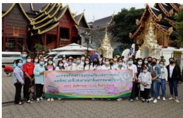
กิจกรรมส่งเสริมคุณธรรม จริยธรรม ศิลปวัฒนธรรมล้านนาและสิ่งแวดล้อม จัดโดย กศน.อำเภอสพพราบ