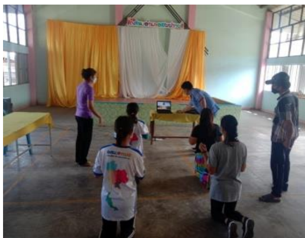
โครงการพัฒนาผู้เรียนเสริมสร้างความสามารถ พิเศษ กศน.ชาลันจ์