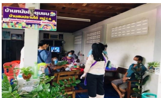
บ้านหนังสือชุมชน หมู่ ๑๔ บ้านสบปราบใต้สามัคคี