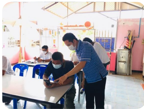
กศน.ตำบลสบปราบ จัดโครงการพัฒนาเศรษฐกิจดิจิทัล กศน.ตำบล หลักสูตร การค้าออนไลน์ e-Commerce): กลยุทธ์การตลาดเชื่อมโยงจาก Online และ Offline โดยผู้ร่วมอบรมฝึกการขายสินค้าออนไลน์