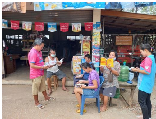
บ้านหนังสือชุมชน หมู่ ๓ บ้านนาปราบ