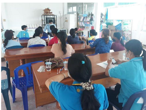
ตำบลสมัย