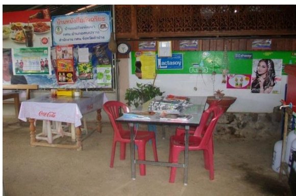
บ้านหนังสือชุมชน หมู่ ๗ บ้านแม่กัวะพัฒนา