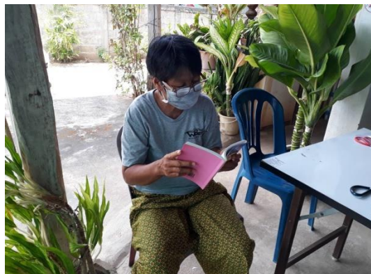
บ้านหนังสือชุมชน หมู่ ๓ บ้านปงกา