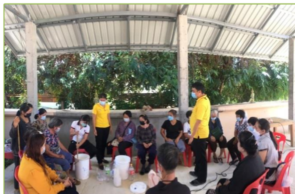
กศน.ตำบลนายนางการทำน้ำสมุนไพรจีนจួយ เพื่อสุขภาพสำหรับผู้สูงอายุ กิจกรรมการทำน้ายาล้างจานเพื่อลดรายจ่ายสำหรับผู้สูงอายุ