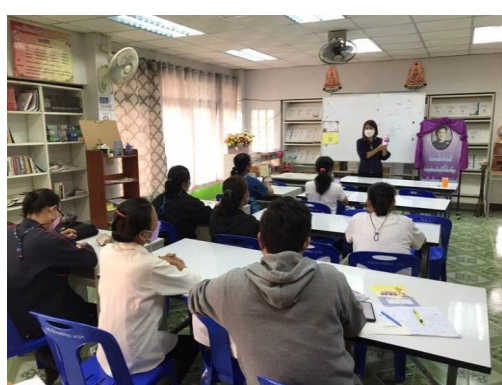
ตารางแสดงผลการดำเนินดำเนินงานกิจกรรมส่งเสริมการอ่านของ กศน.ตำบลสมัย