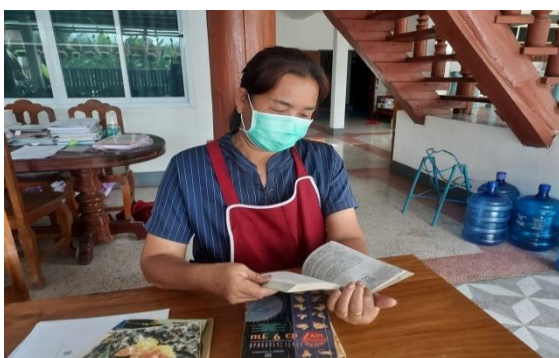
บ้านหนังสือชุมชน หมู่ ๓ บ้านจัวเหนือ