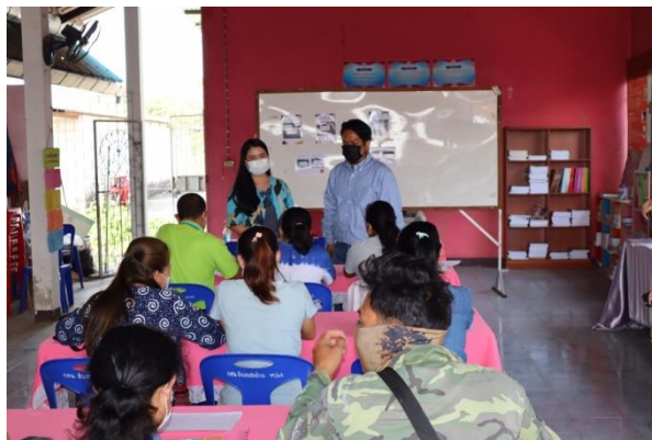
กศน.ตำบลสบปราบ ได้พัฒนาการจัดกระบวนการเรียนรู้ที่หลากหลาย