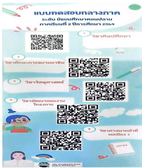
กศน.ตำบลสบปราบ ได้มีการพัฒนาสื่อนวัตกรรมการประยุกต์ใช้เทคโนโลยี