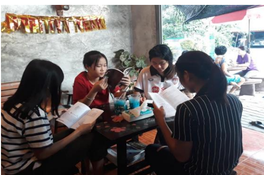
บ้านหนังสือชุมชน หมู่ ๗ บ้านสมัยชัย