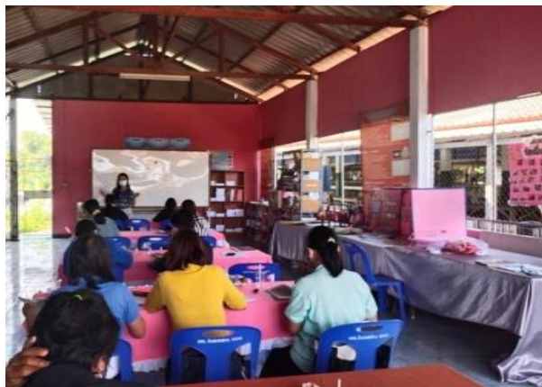
โครงการติวเข้มเพิ่มเติมความรู้ให้กับนักศึกษา กศน.สพพราบ