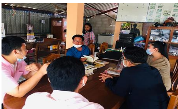
บ้านหนังสือชุมชน หมู่ ๓ บ้านวังพร้าว