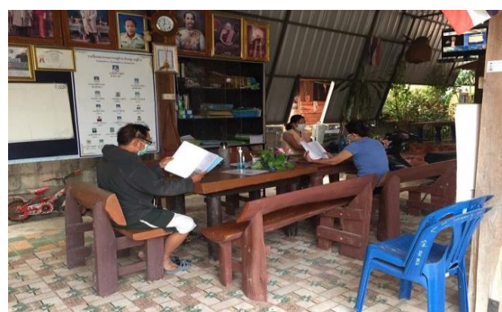
บ้านหนังสือชุมชน หมู่ ๑๕ บ้านหล่ายฮ่องปู่สามัคคี