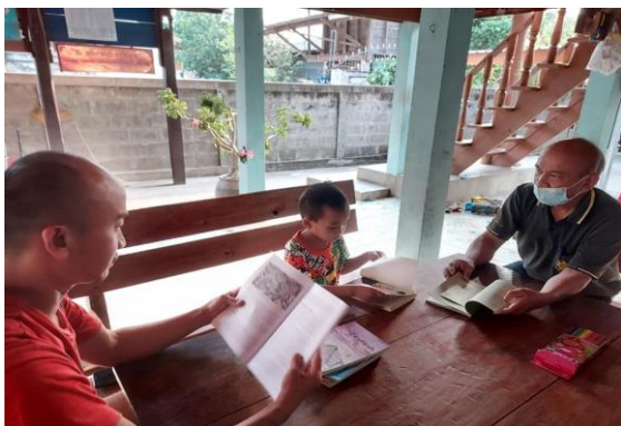
บ้านหนังสือชุมชน หมู่ ๘ บ้านป่าไผ่พัฒนา