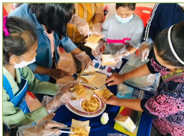
กศน.ตำบลสมัย กิจกรรมส่งเสริมด้านการออกกำลังกาย เพื่อสุขภาพกิจกรรมด้านโภชนาการเพื่อสุขภาพการสำหรับผู้สูงอายุ