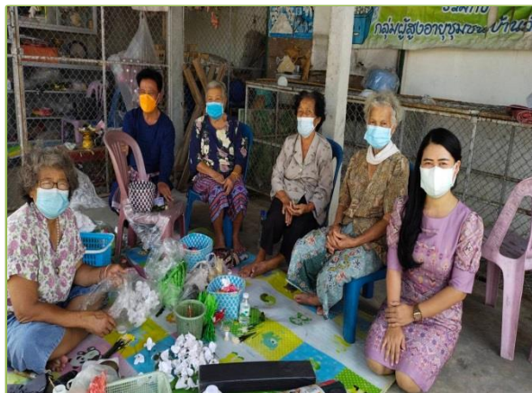
กศน.ตำบลสบปราบ กิจกรรมสร้างสรรค์สำหรับผู้สูงอายุ ด้านโภชนาการในผู้สูงอายุ การทำน้ำเต้าหู้เพื่อสุขภาพ การทำดอกไม้ประดิษฐ์