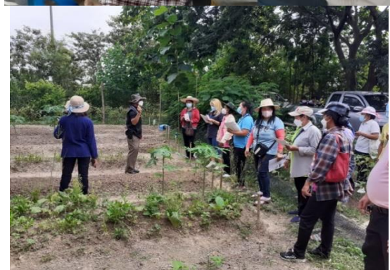
โครงการอบรมพัฒนาผู้เรียนแลกเปลี่ยนการเรียนรู้ ณ วัดกรรมเจ้าท่าโครงาน