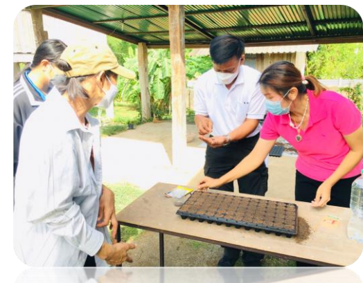
โครงการส่งเสริมการเรียนรู้ตามหลักปรัชญาของเศรษฐกิจพอเพียง การทำปุ๋ยเกษตรอินทรีย์ การเตรียมดินเพาะเมล็ด