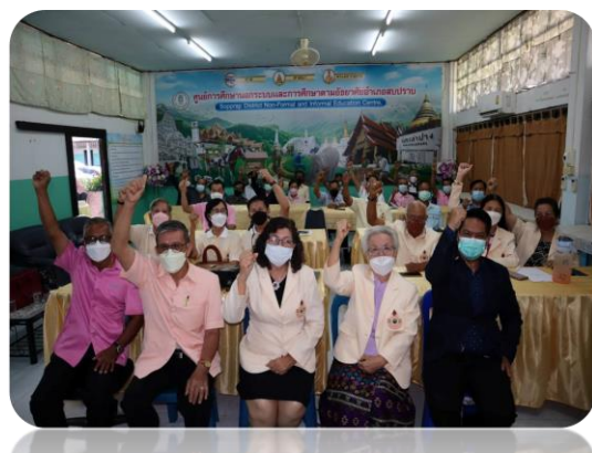
โครงการพัฒนาศักยภาพการใช้ Facebook & Line อย่างถูกต้องปลอดภัย