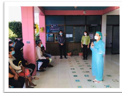
โครงการอบรมให้ความรู้เกี่ยวกับวัคซีน ป้องกันโรคโควิด-๑๙ โรงพยาบาลส่งเสริมสุขภาพประจำตำบลนายาง