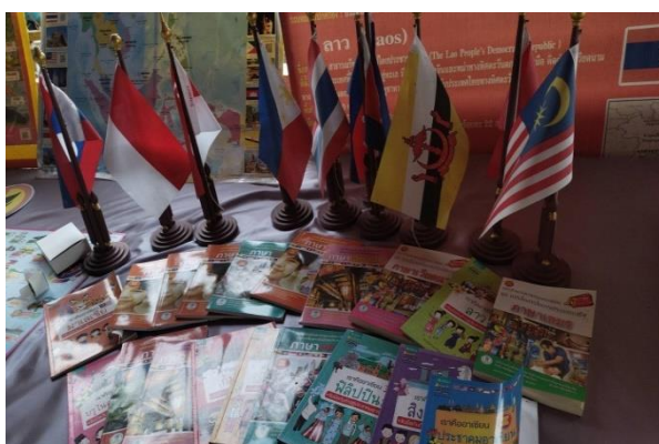
กศน.ตำบลสบปราบได้จัดมุม สื่อการเรียนรู้เพื่อให้บริการ นักศึกษาและประชาชนในชุมชน