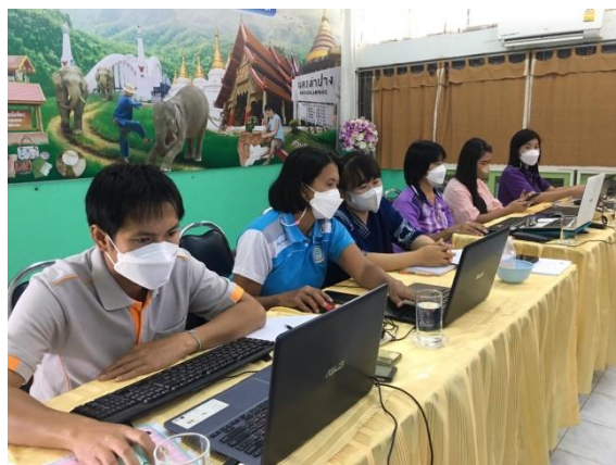
กิจกรรม โครงการพัฒนาบุคลากรตามแนวทางพระราชดำริเศรษฐกิจพอเพียง วันที่ ๑๒ - ๑๔ มกราคม ๒๕๖๕ ณ จังหวัดจันทบุรี