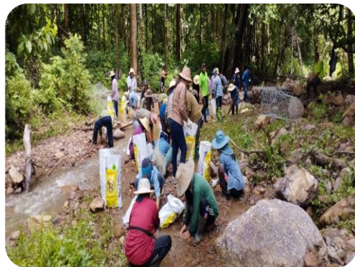
โครงการปลูกป่า บวชป่า สร้างฝายชะลอน้ำเฉลิมพระเกียรติ ณ ป่าชุมชนบ้านแก่น ตำบลนาयाง