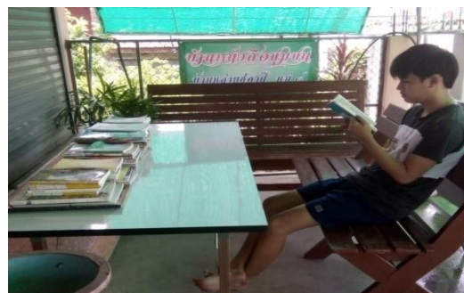
บ้านหนังสือชุมชน หมู่ ๘ บ้านหล่ายฮ่องปู่