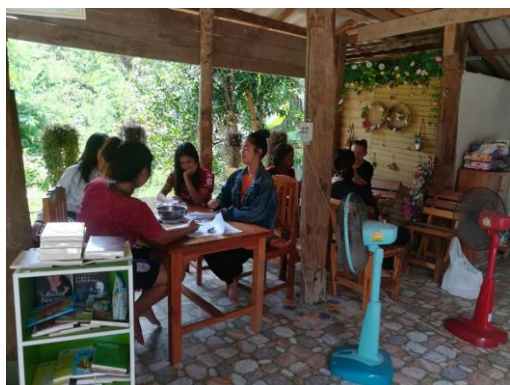
บ้านหนังสือชุมชน หมู่ ๒ บ้านดง