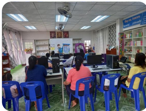
กศน.ตำบลนางาย จัดโครงการพัฒนาเศรษฐกิจดิจิทัล กศน.ตำบล หลักสูตร Digital Literacy การใช้ โปรแกรมสำนักงานเพื่อเพิ่มโอกาสในการมีงานทำ ผู้ร่วมอบรมได้ฝึกปฏิบัติการใช้โปรแกรมสำนักงาน