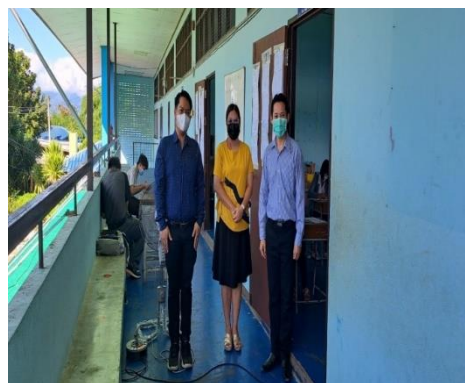
นิเทศงานการศึกษาขั้นพื้นฐาน