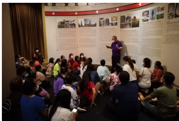
โครงการทัศนศึกษาพัฒนาคุณภาพผู้เรียนการเรียนรู้รอยประวัติศาสตร์ชาติไทย และบุญคุณของพระมหากษัตริย์ไทย