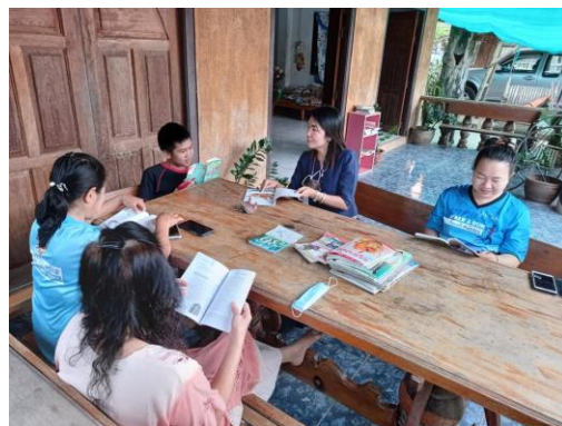
บ้านหนังสือชุมชน หมู่ ๗ บ้านแก่น