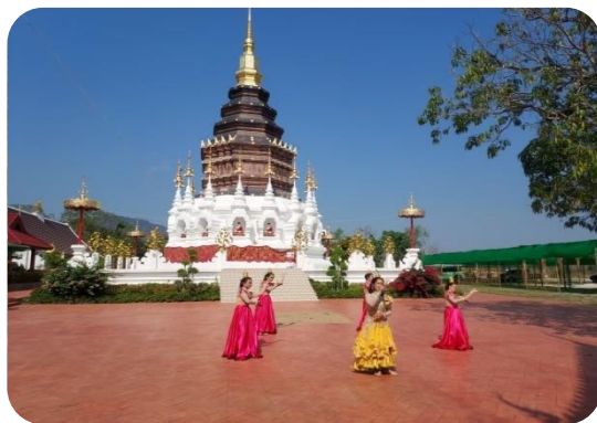
กศน.ตำบลสบปราบ กิจกรรมบทเพลงพระราชนิพนธ์ ในพระบาทสมเด็จพระบรมชนกาธิเบศรมหาภูมิพลอดุลยเดชมหาราชบรมนาถบพิตร (ร.๙)