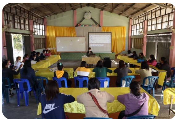
กศน.อำเภอสบปราบ โครงการภาษาอังกฤษเพื่อการสื่อสารด้านอาชีพ หลักสูตร ๑๒ ชั่วโมง ผู้เข้าร่วมจำนวน ๔๐ คน