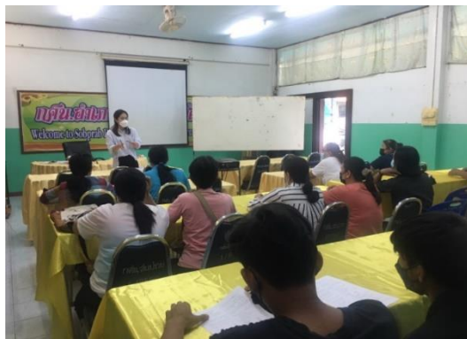
โครงการติวเข้มเติมเต็มความรู้ (N-NET)