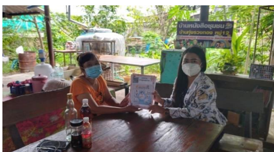
บ้านหนังสือชุมชน หมู่ ๒ บ้านทุ่งรวงทอง