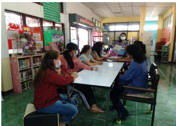
ตำบลสปราบ