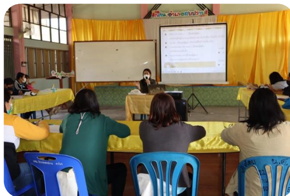
ฝึกให้ผู้เรียนมีความรู้และทักษะในการใช้ภาษาอังกฤษเพื่อการสื่อสารด้านอาชีพได้