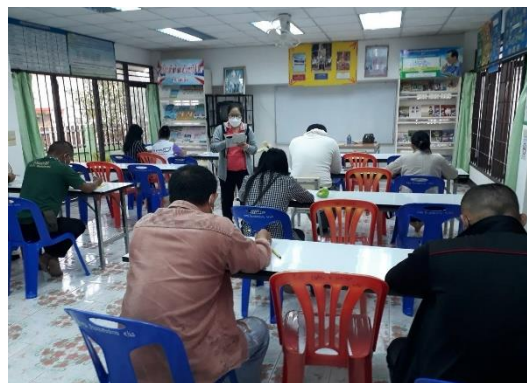
โครงการสอนเสริมเพิ่มเติมความรู้ นักศึกษา กศน.อำเภอสบปราบ