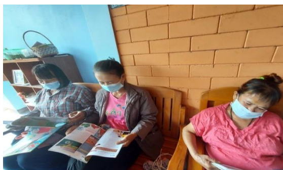
บ้านหนังสือชุมชน หมู่ ๑๓ บ้านเด่นนภา