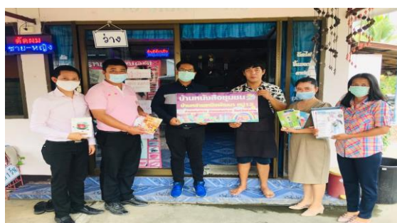
บ้านหนังสือชุมชน หมู่ ๑๓ บ้านหล่ายเหนือพัฒนา