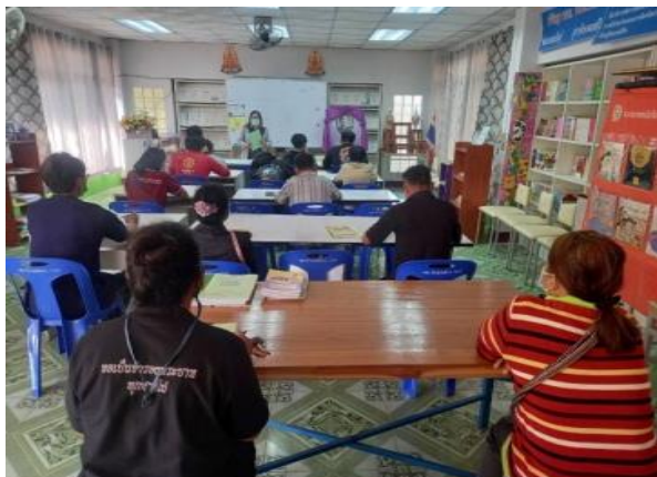
โครงการสอนเสริมเพิ่มเติมความรู้ให้นักศึกษา กศน.อำเภอสปพราบ