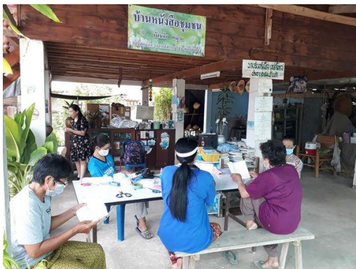
บ้านหนังสือชุมชน หมู่ ๒ บ้านอ้อ