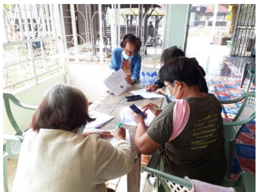
บ้านหนังสือชุมชน หมู่ ๔ บ้านปงกา