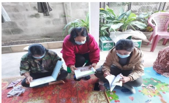
บ้านหนังสือชุมชน หมู่ ๑ บ้านสมัย