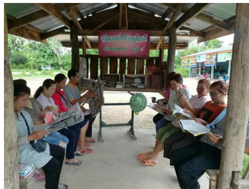
บ้านหนังสือชุมชน หมู่ ๕ บ้านนายาง