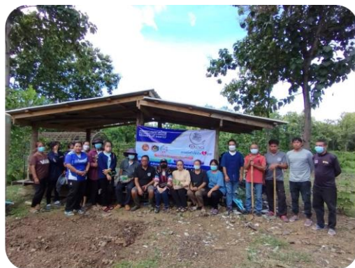
กิจกรรมขับเคลื่อนศูนย์เรียนรู้โคกหนองนาศูนย์เรียนรู้โคกหนองนาหมู่ ๗ บ้านแก่นตำบลนาयाง