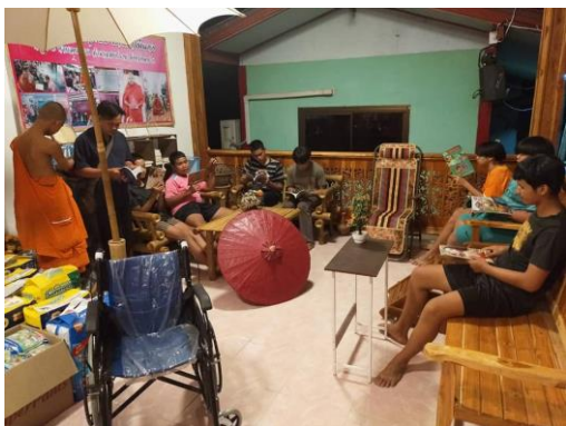
บ้านหนังสือชุมชน หมู่ ๖ บ้านนาไม้แดง