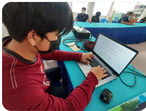
กศน.ตำบลสมัย จัดโครงการพัฒนาเศรษฐกิจดิจิทัล กศน.ตำบล หลักสูตร Digital Literacy การใช้ โปรแกรมสำนักงานเพื่อเพิ่มโอกาสในการมีงานทำ ผู้ร่วมอบรมได้ฝึกปฏิบัติการใช้โปรแกรมสำนักงาน